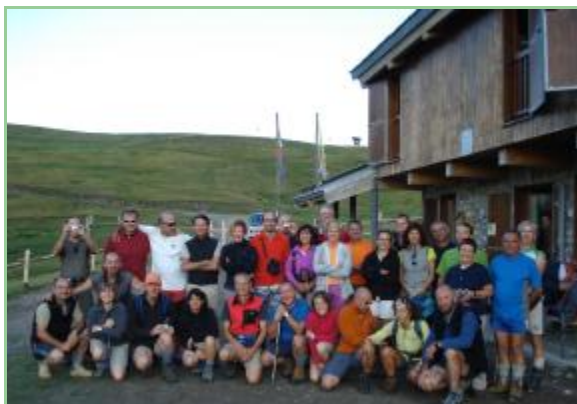
Il Gruppo al Rifugio Don Barbera

vere! Dopo un'ora e mezza di saliscendi giungiamo al Rif. Mongioie m. 1550, posto tappa del secondo giorno. Al Rifugio abbiamo una sorpresa! Troviamo ad aspet-