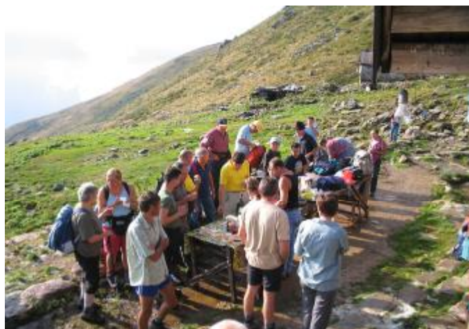
Colazione all'Alpe Paglie Superiore