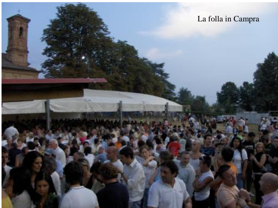
La folla in Campra

Per gli amanti della musica, come da tradizione, ha fatto da padrona la musica da ballo con le cinque orchestre che hanno fatto volteggiare con valzer e polke gli instancabili ballerini. Per i più