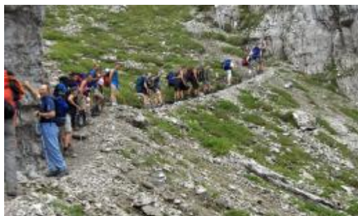
Salita alla Forcella Urtisiel