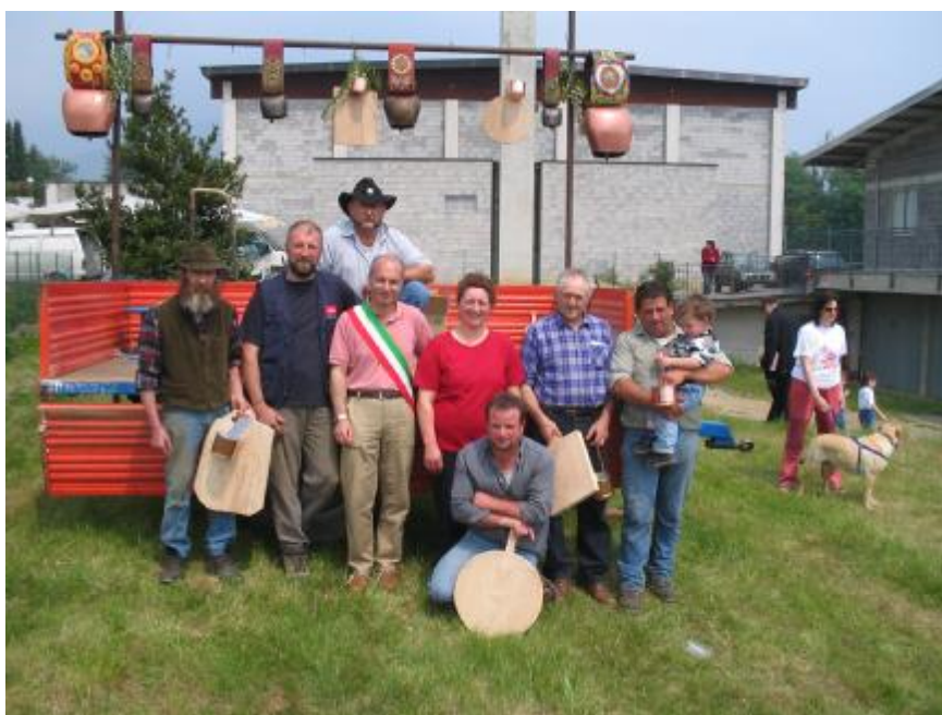
Riconoscimento agli Allevatori

In concomitanza con la fiera primaverale, per il terzo anno consecutivo, i coscritti della Valle Elvo hanno deciso di festeggiare a Graglia il passaggio alla maggiore età. Per tre giorni la palestra comunale è stata così animata dalle risa e dall'allegria dei coscritti. La discoteca Midnight e il trio Acqua Marina li hanno fatti ballare con tutti quelli che hanno voluto rendere ancora più bella e divertente la festa per i nati nel 1987.