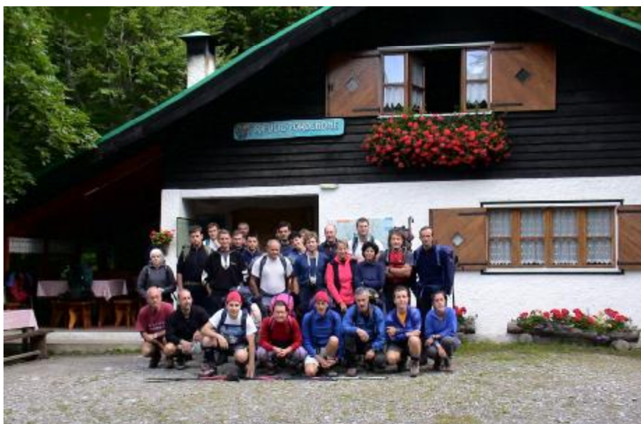
Il gruppo al Rifugio Pordenone

ziato la sua corsa verso il Rifugio Pordenone, che ci ha riservato per gli ultimi minuti di cammino una salita mozzafiato!