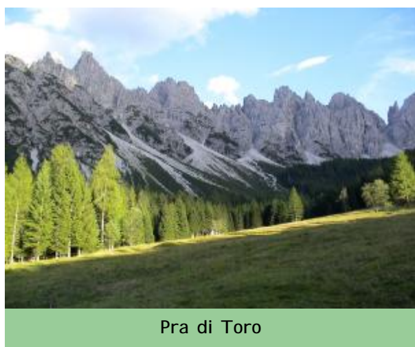
Pra di Toro

Il nostro cammino è proseguito in discesa fino alla Val Meluzzo, poi tra pietre e massi qualcuno ha ini-