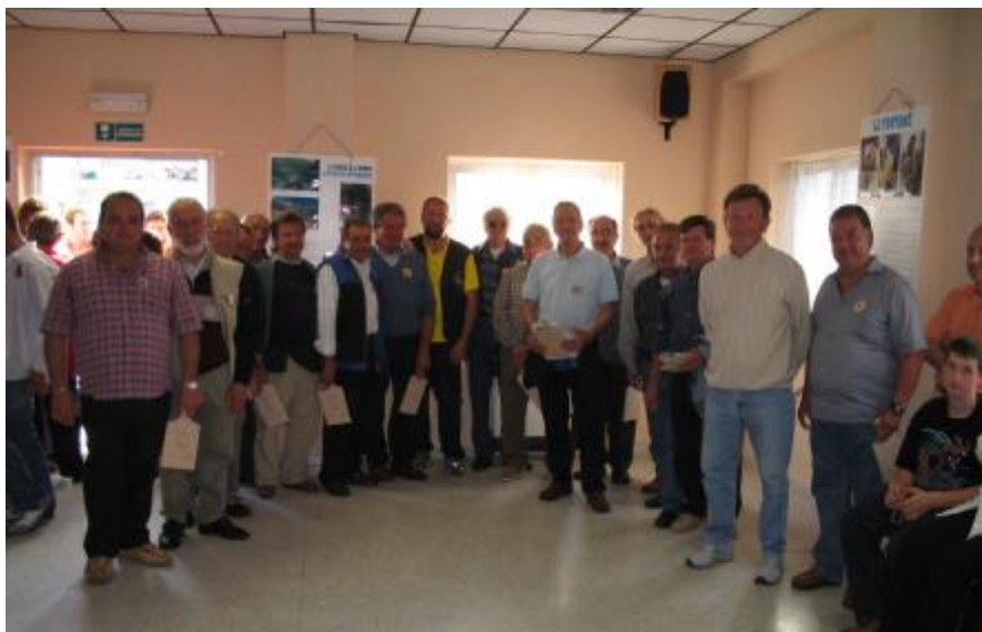
Presentazione dei gruppi canori in sede

I canti sono poi continuati durante e dopo la cena, e qui la magia che il canto riesce a sprigionare si è manifestata proprio in tutta la sua spontaneità, con una piccola bimba che è riuscita a stupire i presenti, richiamando per un istante tutta l'attenzione su di sé.