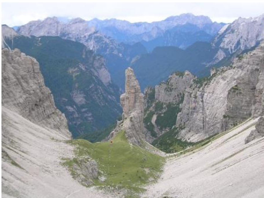
Il Campanile di Valmontanaia

Passo dopo passo siamo arrivati alla tanto amata pausa pranzo; si perché il trekking non è fatto solo di cammino, ma anche di incredibili soste mangerecce dove ogni