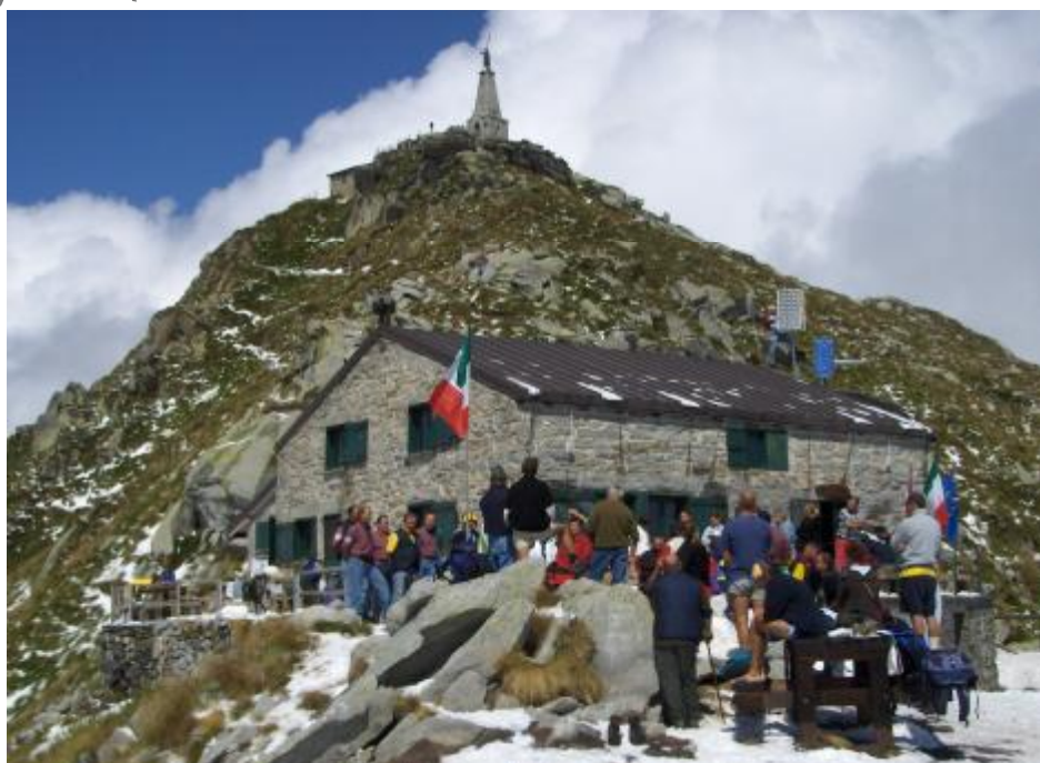
S. Messa al Rifugio Mombarone